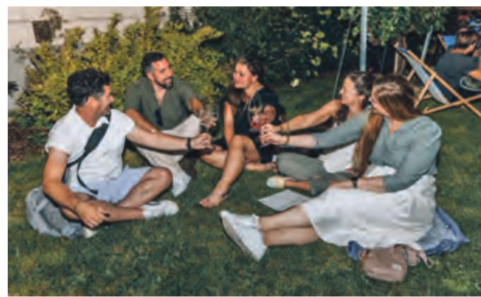
Ungezwungene Weinverkostung bei den SeeWinzerInnen

Leinen los für den Genuss! Die Podersdorfer SeeWinzerInnen laden zur großen Weinreise an den Neusiedler See ein. Die „Lange Nacht der Podersdorfer Weine“ dauert vier Tage (16. bis 19. Juli), an denen sich alles um edle Tropfen, kulinarische Höhepunkte und echte Gastfreundschaft dreht.