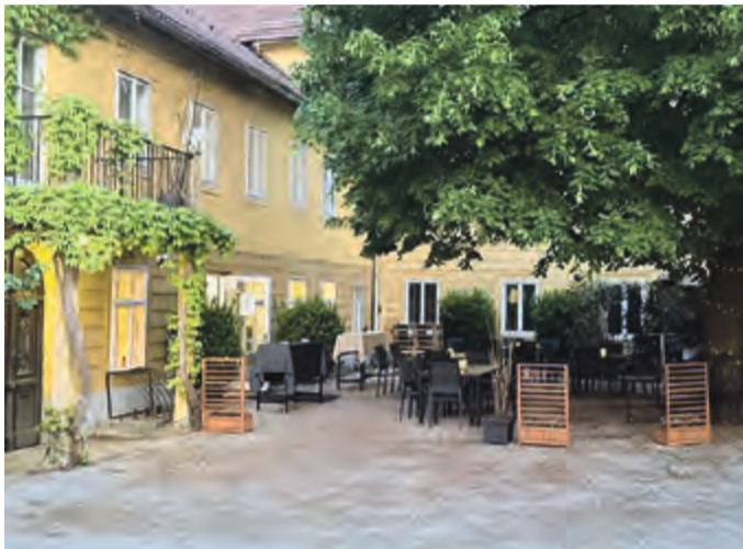
Das „Babsi's“ in den alten Graumann-Gemäuern bietet einen gemütlichen naturschattigen Gastgarten. Dienstag, Sonntag und feiertags hat das Lokal geschlossen.