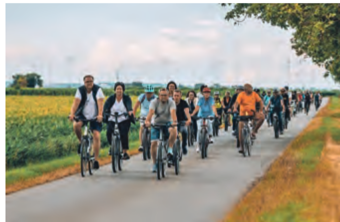
Geführte Radtour zu den Weingütern mit Kostproben