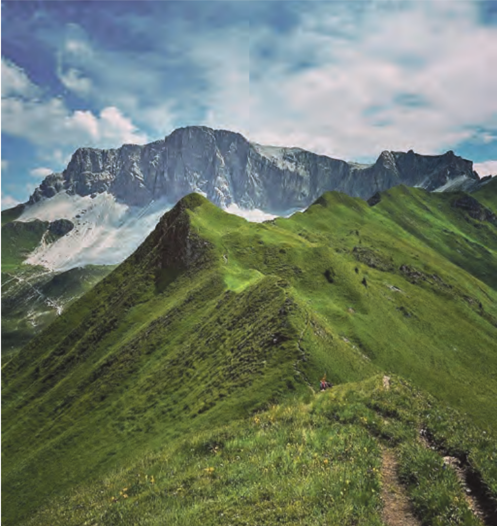
Blick vom 2.289 m hohen Jägglich Horn auf den Prättigauer Höhenweg. Von da geht es hinab ins beschauliche St. Antönien, das sich selbst „Hinter dem Mond links“ sieht.

Jahrhundertlang blühte zwischen Vorarlberg und der Schweiz der illegale Handel über die Berge. Auf diesen Schmugglerpfaden führt eine dreitägige Tour grenzüberschreitend rund um die 2.770 m hohe Madrisa. Dabei kommt man auch „Hinter dem Mond links“ vorbei. „Hallo“ hat sich in dieser malerischen Gegend umgesehen.