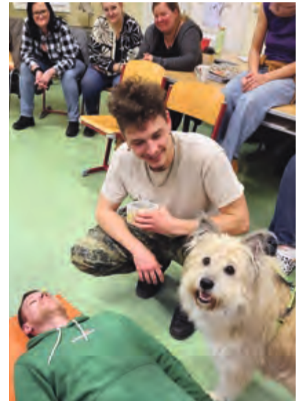
Therapiehund Marlo in der Caritas-Schule Josee in Ebensee

Infoabende finden regelmäßig statt. Anmeldungen für alle Ausbildungsbereiche mit Start im September sind ab sofort möglich. Info: www.ausbildung-sozialberufe.at