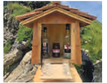
Schnapsbar am Jägglich Horn als Kraftquelle (ob.). Mit „Trottis“ kamen wir hinter dem Mond links an (u.).