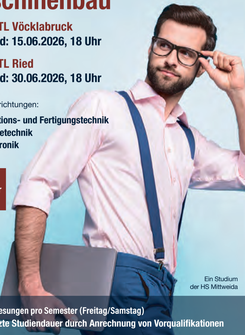
Ein Studium der HS Mittweida